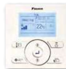
BRC073 en option.